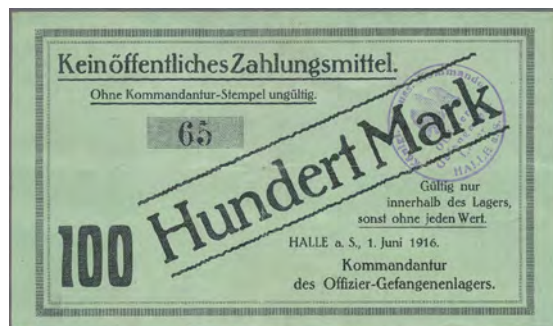
ex Los 2697