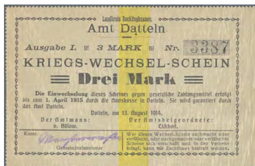
ex Los 2701